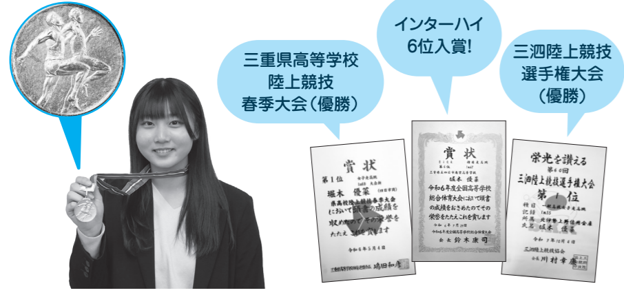
▲過去の大会の賞状(一部)

体育大会)です。1m67cmという記録で、6位に入賞することができました。また、同じ年に「国民スポーツ大会」に出場できたことも、とてもよい思い出です。インターハイの直後だったこともあり、思うような結果が出せなかったのが悔しいですが、大舞台に立てたことが何よりもうれしかったですね。自己ベストの記録は、2024年の三重県高等学校陸上競技春季大会で跳んだ1m69cmで、これは大会新記録にもなりました!